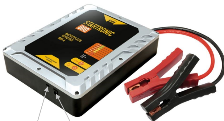
Mikro USB (5V / 2A)

Kompaktin (1860g) koon ansiosta laite on helppo kuljettaa mukana ja se mahtuu helposti hansikaslokeroon tai tavaratilaan.